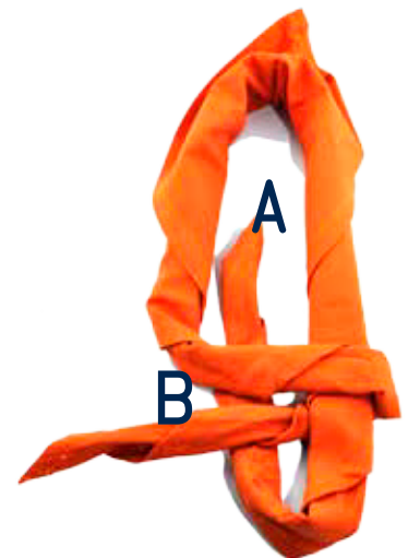
Führt A unter beiden B-Teilen durch.