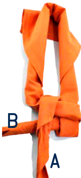
Legt die Spitze von A über beide B-Teile drüber.