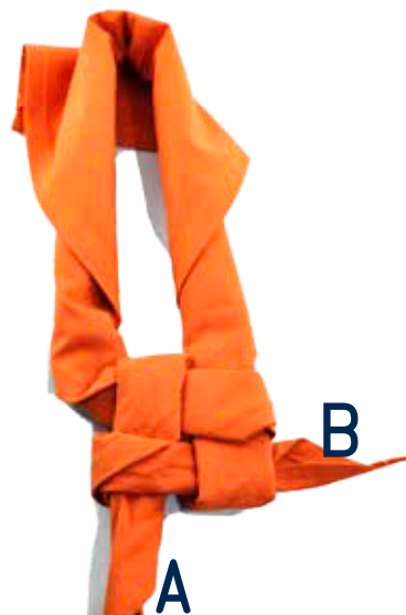
Legt B über A und steckt B durch die Schlaufe durch.