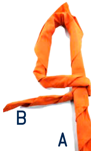
Führt B unter A hindurch.