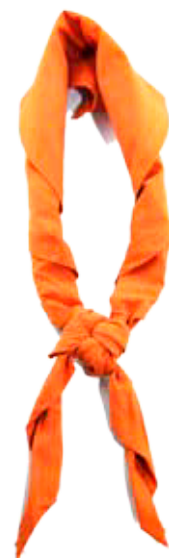
Zieht den Knoten langsam fest.